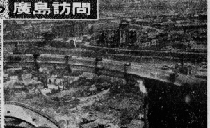
六年前のあの空から 広島訪問 （前掲）六年前の八月六日、広島に投下された原子爆弾の被害状況を写した。写真は、市街地がほぼ完全に破壊された様子を示している。