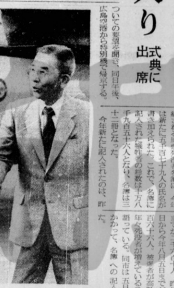
広島入りした中曽根首相と広島市長の出席を祝う中曽根首相(左)と市長(右)の握手。 (取材：本報記者)

中曽根首相が8日(土)、広島市本町1丁の広島平和記念公園に到着し、原爆の日を記念する行事に参加した。首相は、約10万人の市民と共に、平和の祈りを込めて行事に参加した。首相の広島入りは、市民から大きな歓迎を受け、首相は「広島市民の心を一つにする重要な行事に参加でき、心から感謝している」と述べた。