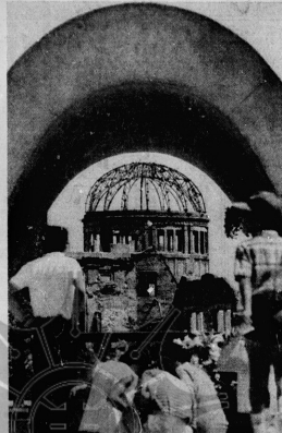
きょう原爆の日。靖国公園への参りへ残存の校舎は重く、祈りは続く。(6日、広島平和記念公園で)

「原爆の日」は、広島市民にとって特別な日である。30年前のこの日、広島市は原子爆弾の被害を受けた。この日、市民は祈りを捧げ、平和を願い、未来を誓った。この日、市民は祈りを捧げ、平和を願い、未来を誓った。この日、市民は祈りを捧げ、平和を願い、未来を誓った。