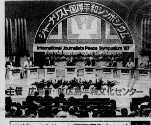
87ジャーナリスト国際平和シンポ 広島

保有国5統と INFは食い違い 本紙代表ら INFは食い違い 核軍縮に関する記事本文。保有国5統とINFに関する議論や食い違いについて探る。