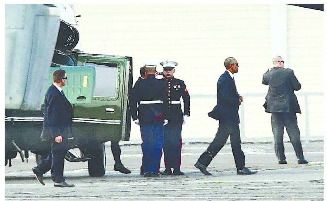
広島に降り立ち、車で平和記念公園に向かうオバマ氏(右から2人目)。午後5時4分、広島市西区の広島ヘリポート。