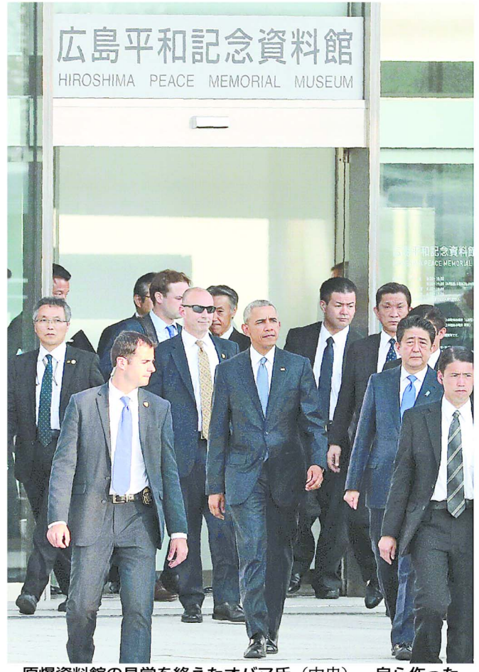
原爆資料館の見学を終えたオバマ氏(中央)。自ら作った折り鶴を同館に託した。午後5時35分。

「8月6日の記憶を風化させてはならない」。平和記念公園で原爆ドームを背に所感を述べるオバマ氏(右)。左は安倍晋三首相(午後5時45分)