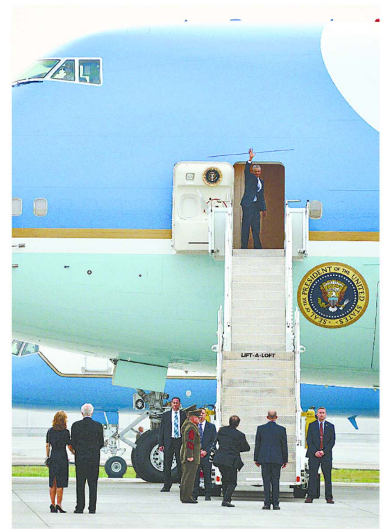
専用機に乗り込み、米国への帰路に就くオバマ氏(右)。午後7時、岩国市の米海兵隊岩国基地。