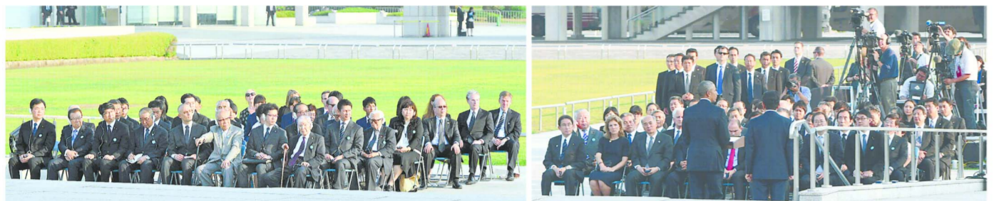
「ヒロシマ演説」発表時の被爆者、日米要人並ぶ様子の席

5月27日のオバマ米大統領の広島訪問。かつてない物々しい警備が敷かれ、平和記念公園(広島市中区)での訪問行事には限られた招待者や関係者約100人が立ち会った。招待者のうち被爆者は10人。オバマ氏は原爆資料館で何を見て、どう振舞ったのか。「ヒロシマ演説」を静寂の中で聞いた被爆者や若者はどう受け止めたのか。あの「52分」を再現する。(田中美千子、有岡英俊、水川恭輔、久保友美恵)