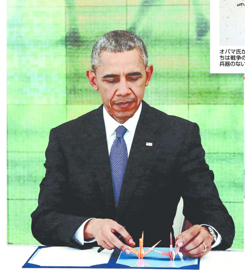
メッセージの横に折り鶴を添えるオバマ氏