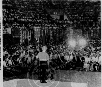
平和の祈りを込めて、市民が平和の祈りを捧げる。 (広島市平和記念公園)

「反原発」の姿勢を鮮明に示す。原子力発電は、環境汚染のリスクが高く、安全性が確保できない。再生可能エネルギーへの転換を急ぐべきである。政府は、原子力発電の廃止を断言し、再生可能エネルギーの普及を促進するべきである。