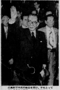
広島戦で市民の救済を呼び、手もよぼこたせる三木首相 (広島平和記念公園)

三木首相が広島入りし、平和の祈りを捧げる。三木首相は、広島を訪問し、平和の祈りを捧げ、平和を誓った。三木首相は、平和を築くために、互いに理解と尊重をもち、対話を続ける必要があると述べた。