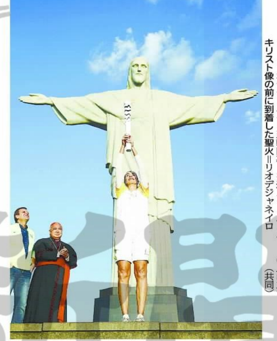
5日、リオデジャネイロ五輪開会式を迎え、コルコバードの丘に立つキリスト像の前に到着した聖火リレー選手たち

【リオデジャネイロ共同】「リオデジャネイロ共同」記す1冊を含め11冊に。原爆投下時刻の8時15分に参列者全員で1分間黙とう。遺族代表の己斐東小教諭(本宗祐さん)は「西區」も代表の観音小6年武田結衣さん(11)が「平和の鐘」を打ち鳴らし、追悼する。松井市長は平和宣言で、オバマ氏のヒロシマ演説から「核を保有する国々は恐怖の論議から逃れ、核兵器のない世界を追求する勇氣を持たなければならない」との節を引いて、核兵器の廃絶への行動を世界へ呼び掛ける。各国のリーダーには被爆地訪問を要請。核兵器禁止の法的枠組みをつくる必要性を強調する。この間代表の竹屋小6年中興(穂積さん)は「中區」に亀山小6年青木優太君(12)は「安佐北区」が「平和への誓い」を発表。4年連続の出席となる安倍晋三首相もあいさつする。厚生労働省によると、3月末時点で被爆者は1万4080人。平均年齢は80.86歳。(岡田浩平) 第31回夏季オリンピック・リオデジャネイロ大会は5日午後8時(日本時間6日午前8時)からリオデジャネイロ市中心的なマラカナン競技場で開会式を行い、17日間の熱戦が開幕。史上最多205カ国・地域に、初めての試みとなった難民五輪選手団など1万1千人を超える選手が集う。5・19・20・31面に関連記事 4日の練習後にこの大会に懸けてきた。われわれは頂点を目指す。いよいよ始まりに近づいた。オバマ大統領は「リオデジャネイロ」をテーマにしたスピーチで、大会運営を学ぶ貴重な場ともなる。約1700人の職員を派遣した東京五輪組織委員会が、大会運営を学ぶ貴重な場ともなる。