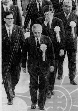
二階堂首相は形勢判断が急務と見られる。被爆者の生活保護を具体化する。二階堂首相(左)と閣僚ら(右)が歩いている。