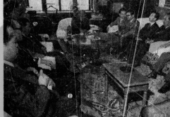
議長収拾について各党議員は話し合う。議長収拾について各党議員は話し合う。

田中首相ら帰国。被爆者の生活保護を具体化する。二階堂首相(左)と閣僚ら(右)が歩いている。