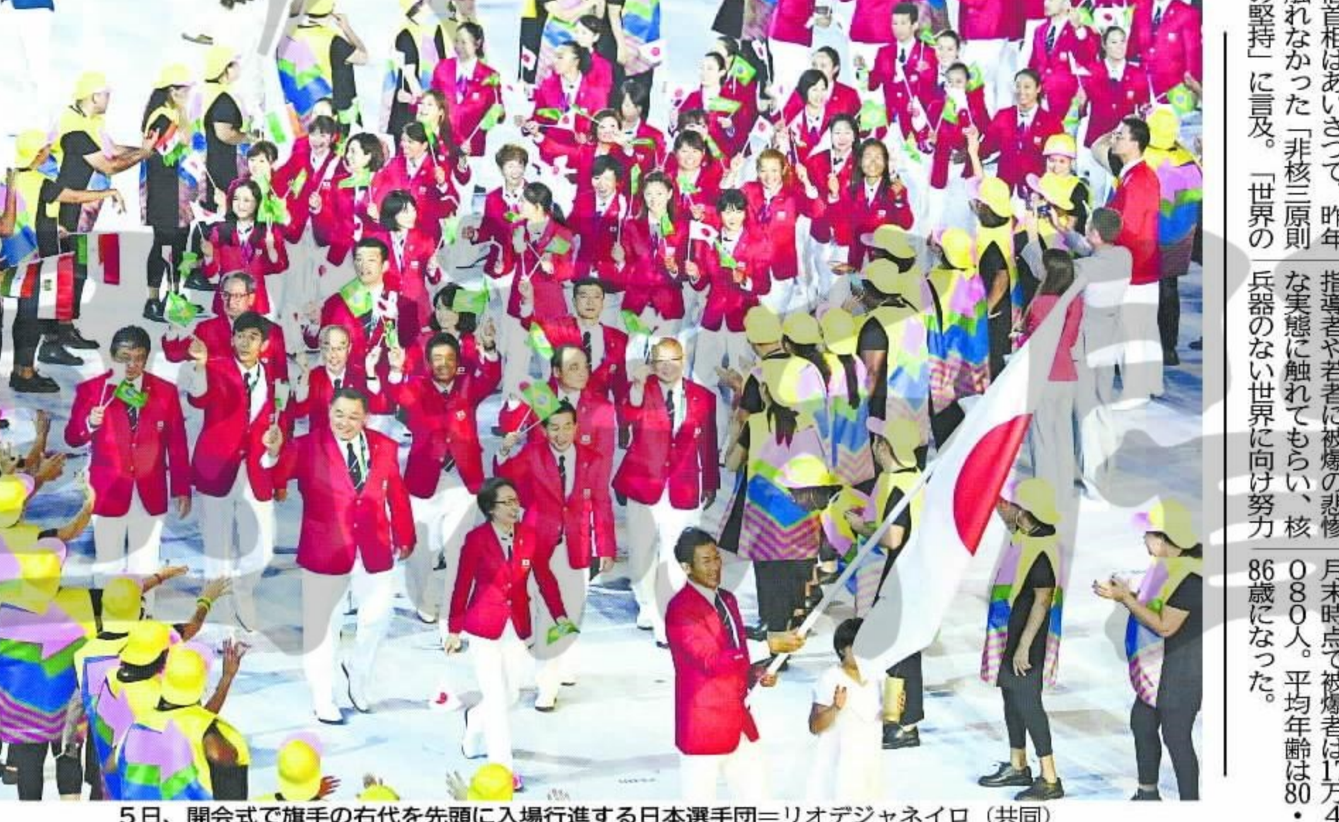
5日、開会式で旗手の右代を先頭に入場行進する日本選手団＝リオデジャネイロ